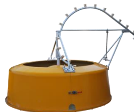
Figaro / Figarino

промежуточная система хранения кабеля, во избежание укладки «восьмёркой»